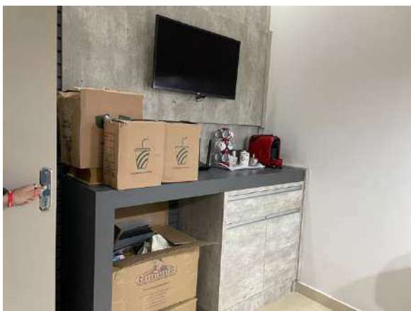
Figura 2- Sala da Gerência

De seguinte, promovemos uma visita as instalações do Centro de Distribuição, onde está centralizado o estoque da Requerente, que é distribuído as filiais todas as segundas, quartas e sextas-feiras.