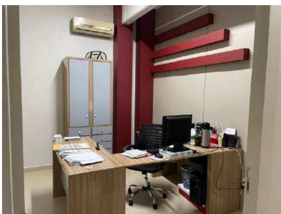
Figura 3- Sala do Financeiro e Banheiros