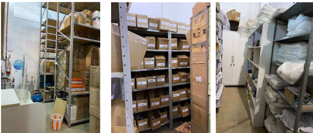
Figura 7- Sala de Medicamentos Controlados e Acessórios