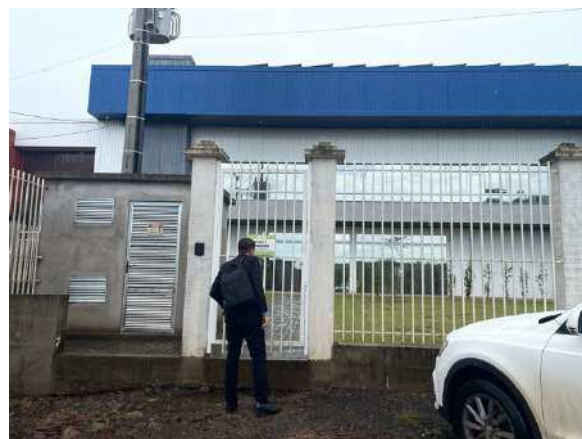
Figura 1- Frente da Empresa

Na oportunidade, procedemos com uma breve reunião, questionamos alguns pontos relativos as operações da empresa, seu histórico, projeções de faturamento para o ano de 2023, ações já realizadas pela empresa para a superação da crise econômico e financeira, entre outros levantamentos pertinentes a execução dos trabalhos e as contidas no artigo 47 da Lei 11.101/2005.