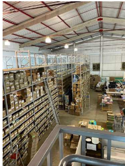
Figura 4- Vista de Cima do Estoque