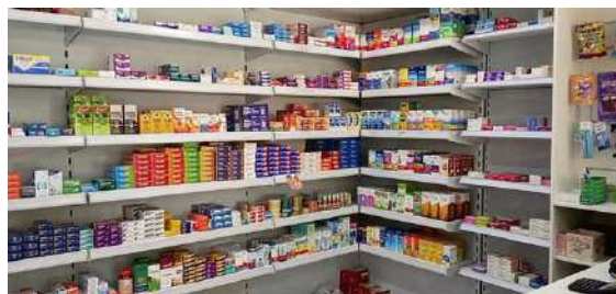
Figura 9- Fotos de algumas filiais ativas

No mais, a Requerente e seu corpo jurídico e consultivo mostraram-se ativa, aberta e disposta a cooperar com as informações pertinentes a realização dos trabalhos, de forma ordenada, organizada e eficiente.